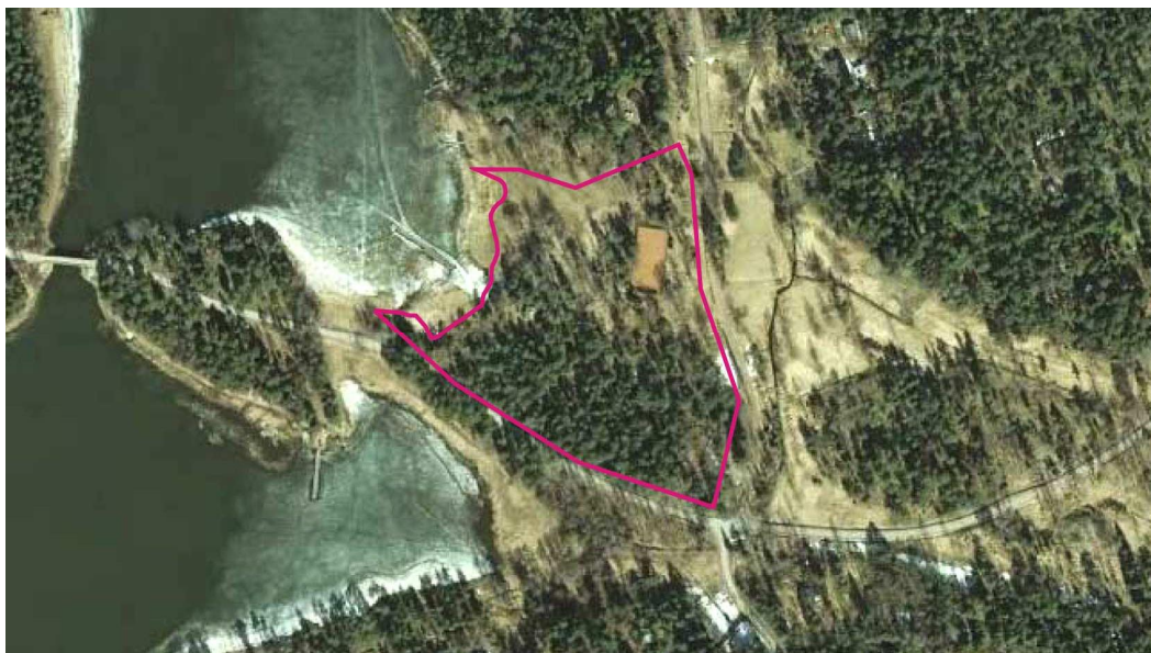
Ilmakuva. Suunnittelualue merkitty punaisella viivalla.

Alueen luonto-olosuhteet ovat alueen sijaintiin nähden tyypilliset. Alueelle laaditaan luontoselvitys (Silvestris Oy).