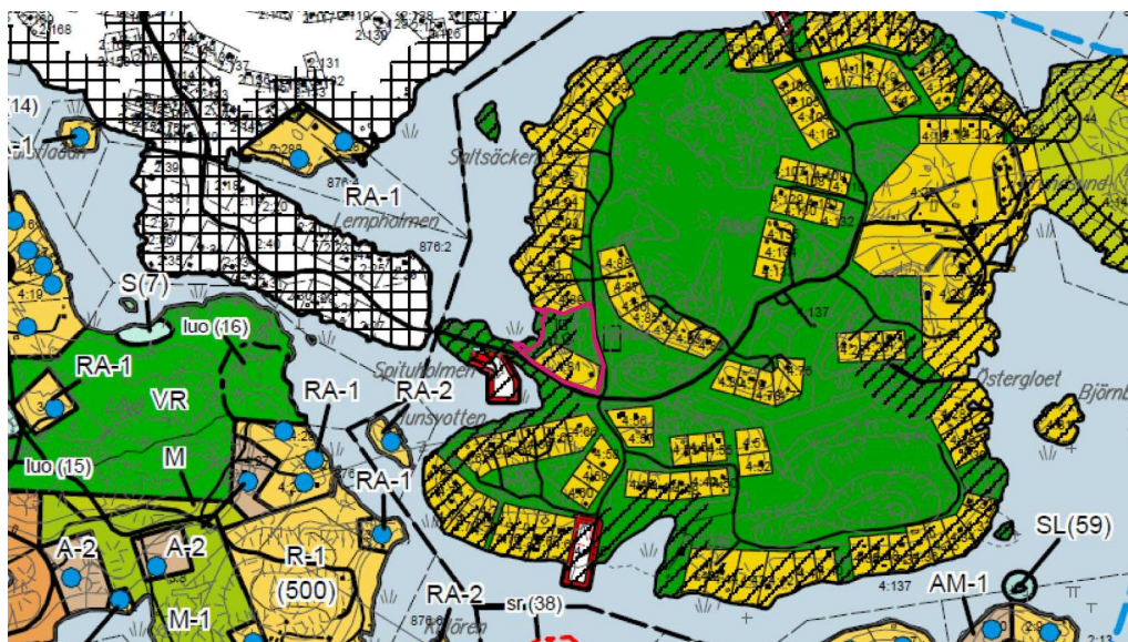
Ote itäisen saariston yleiskaavasta. Suunnittelualue merkitty punaisella viivalla.

Alue on Tammisaaren itäisen saariston osayleiskaavassa mainittu ranta-asemakaavoitettuna alueena.