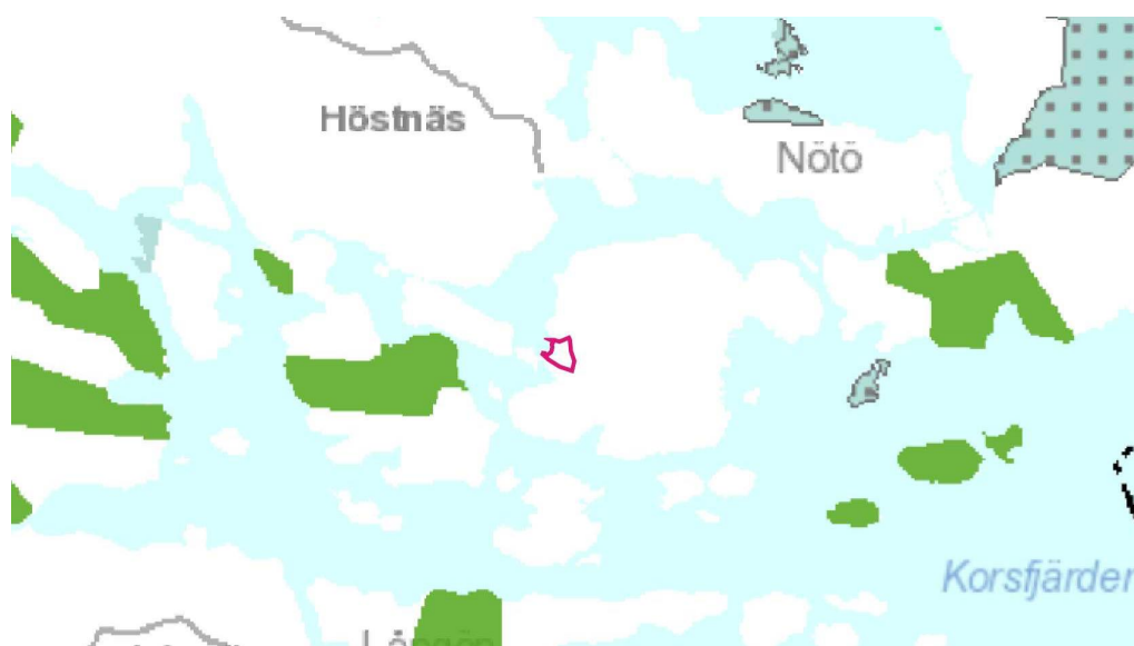
Ote Uudenmaan vahvistettujen maakuntakaavojen yhdistelmästä 2014, 1-3. vaihekaava. Suunnittelualue merkitty punaisella viivalla.

Raasepori kuuluu Uudenmaan liiton toimialueeseen. Uudenmaan maakuntavaltuusto hyväksyi Uudenmaan maakuntakaavan 14.12.2004. Ympäristöministeriö vahvisti Uudenmaan maakuntakaavan 8.11.2006. Uudenmaan 1. vaihemaakuntakaava on hyväksytty 17.12.2008. Uudenmaan 2. vaihemaakuntakaava on hyväksytty 20.3.2013. Uudenmaan 3. vaihemaakuntakaava on hyväksytty 14.12.2011. Maakuntakaavassa kaava-alueelle ei ole annettu merkintöjä.